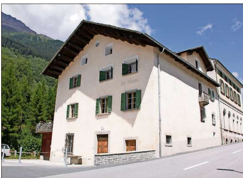
Chasa nativa da Giovanni Giacometti a Stampa.