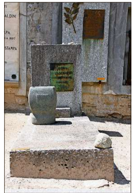
La fossa dad Alberto Giacometti a Borgonovo.