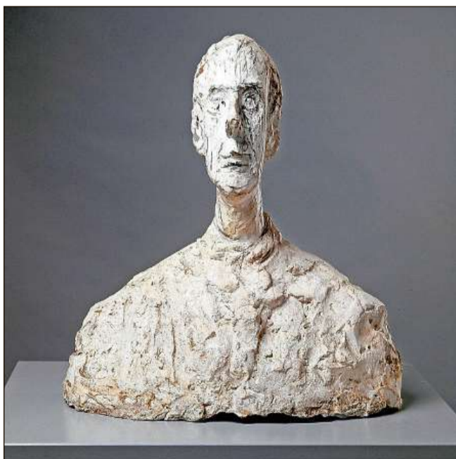
Sculptura dad Alberto Giacometti che represchenta ses frar Diego.

Il 1898 è naschids ils pitschens pastels abstracts sco era ovras marcadadas dal giapunissem e dal stil floreal. Suentar ina perioda d'actività creativa 1901–07, influenzada fermamain da la renaschientscha taliana tempriva e dal simbolissem («La notte», 1903), ha Giacometti cun-